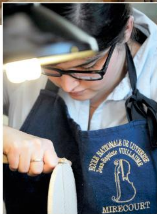
Une élève de l'École nationale de lutherie en plein travail. L'institution, mondialement connue, a été fondée en 1970 par Étienne Vatelot, qui fut le luthier de Stern et Rostropovitch.

Ci-dessus : Roland Terrier dans son atelier. Il y fabrique et restaure les instruments du quatuor (violon, alto, violoncelle et contrebasse).