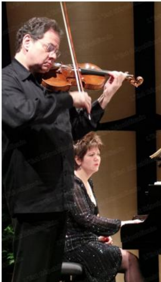
5e Rencontres internationales de Mirecourt : une fin en beauté

TAGS : A LA UNE | RÉGION LORRAINE | VIDÉOS | VIDÉO RAP