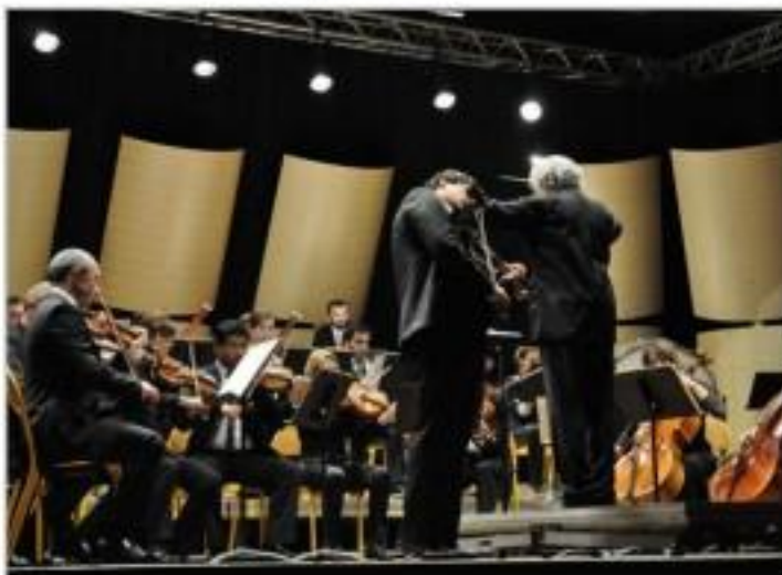
Les rencontres internationales de Mirecourt débuteront le 19 novembre.

■ Cinquièmes rencontres internationales de Mirecourt du 19 au 24 novembre. Tarifs : 8-20 €. Renseignements et réservations à l'office du tourisme de Mirecourt au 03 29 37 01 01.